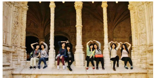
▲暑期遊學團、大三留學皆能增進學生的國際力。