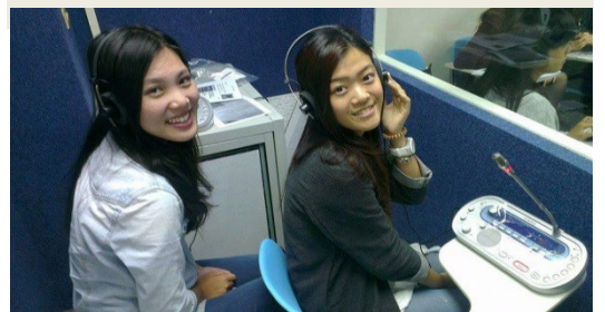
▲口譯教室培養學生豐富實戰經驗。